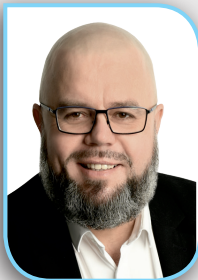
Piotr Kotas wiceprzewodniczący Rady Gminy